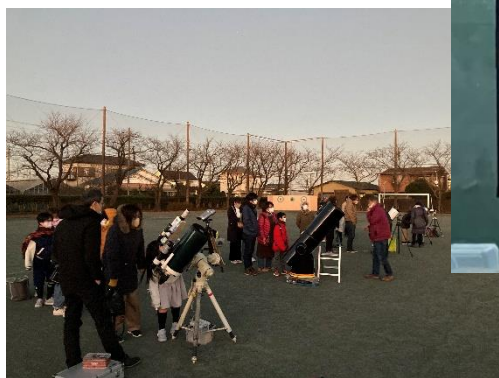
↑ 城島小学校校庭での星空観察

来年は四季の星座の変化を体感できるような企画に仕立て、学びの里としての1ページを追加できればと思います。